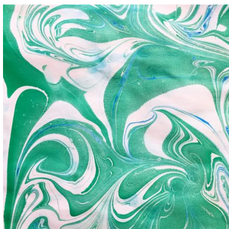
Avec le bain Marbling

Les peintures Marbling peuvent également s'utiliser dans l'eau sans le bain Marbling. L'effet marbré est alors plus resserré et les teintes plus pastel.